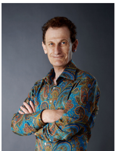
北歐設計顧問有限公司